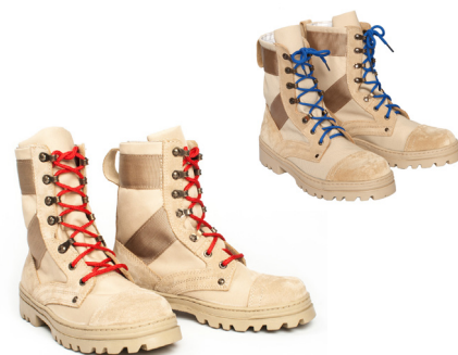
Ботинки с высокими берцами утеплённые бежевого цвета со шнурками красного (синего, бежевого) цвета