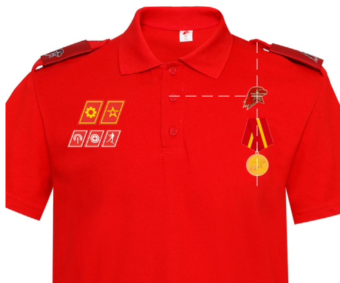
Размещение знаков различия, знаков отличия и иных геральдических знаков на рубашке поло красного (синего) цвета