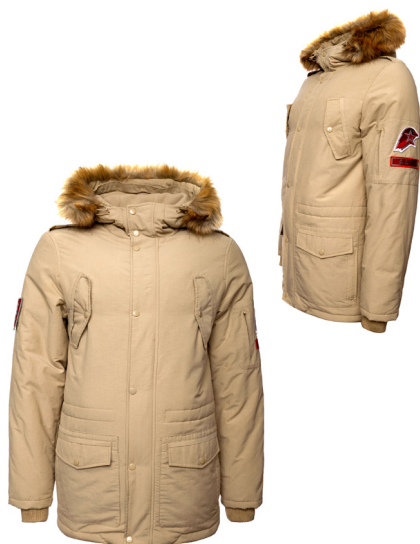
Куртка зимняя утеплённая бежевая с капюшоном и отделкой к капюшону из искусственного меха коричневого цвета