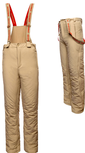
Брюки утеплённые (тактические) бежевого цвета