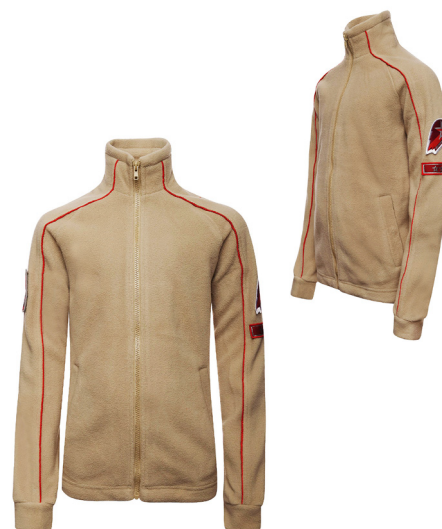
Жакет флисовый бежевого цвета