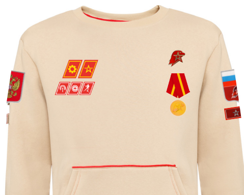
Размещение знаков различия, знаков отличия и иных геральдических знаков на толстовке бежевого цвета