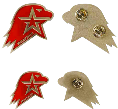
Большая (кокарда) и малая (значок) эмблема ВВПОД «ЮНАРМИЯ»