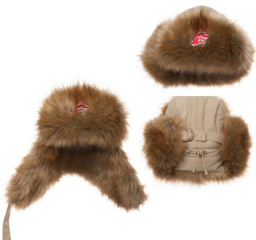
Шапка-ушанка бежевая с искусственным мехом коричневого цвета