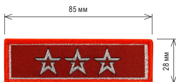
Нарукавный знак, определяющий принадлежность к ВВПОД «ЮНАРМИЯ»