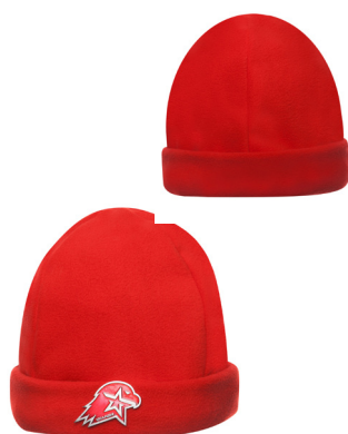
Шапка флисовая вязаная красного цвета